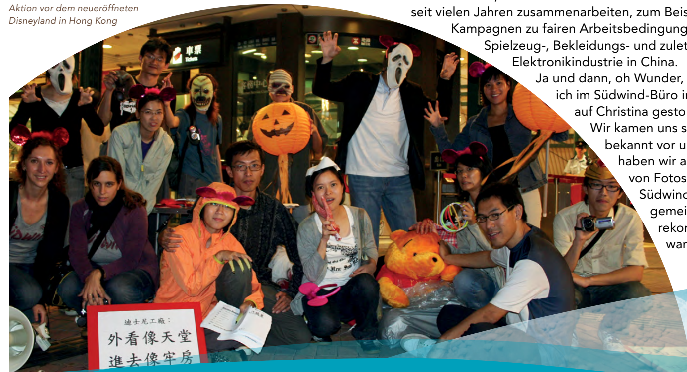
Aktion vor dem neueröffneten Disneyland in Hong Kong

Auf jeden Fall danke ich Südwind für die Einladung und die erfolgreiche Tour – damit sind die beiden Organisationen wieder ein Stück weiter zusammengerückt und ich freue mich auf neue gemeinsame Projekte in der Zukunft.