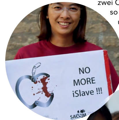
Beim Durchsuchen der alten Fotos im Sommer 2017